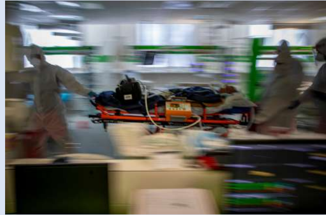
Un grupo de paramédicos transportan a un paciente Covid-19 fuera de un hospital con ocupación del 100% en República Checa.