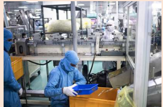
Trabajadores en una fábrica de jeringas en la India.