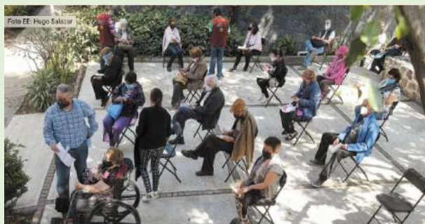
Centro de vacunación Covid-19 en la Ciudad de México.