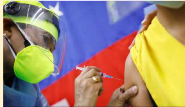
Aplicación de vacunas Sputnik V contra Covid-19 en Venezuela.