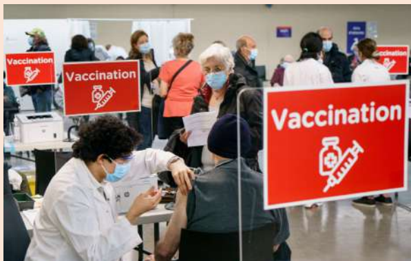
Centro de vacunación en el Estadio Olímpico de Montreal, Canadá.