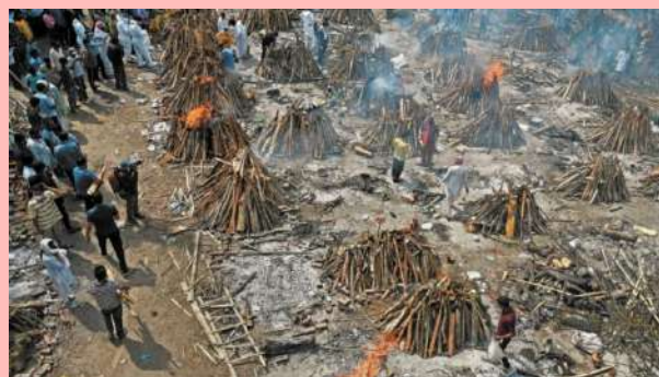
Fogatas de incineración para personas fallecidas por Covid-19 en la India.