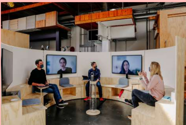
Formato híbrido de reuniones implementado por Google. The New York Times.