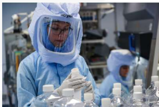
Preparación de la vacuna Covid-19 en el laboratorio de BioNTech, Alemania.