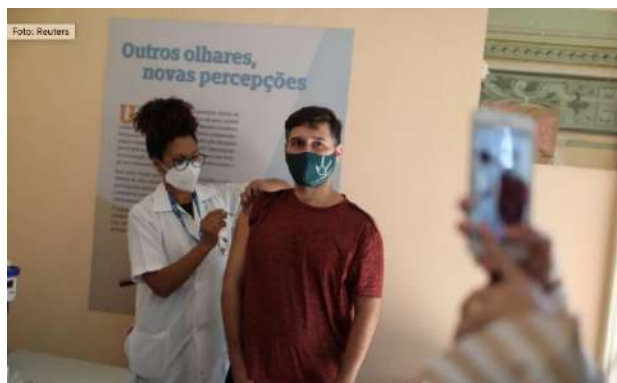
Campaña de vacunación contra Covid-19 en Brasil.

- Un estudio en Chile mostró que la vacuna de AstraZeneca tiene una eficacia del 76% para prevenir la infección del virus 15 días después de la aplicación de la segunda dosis.