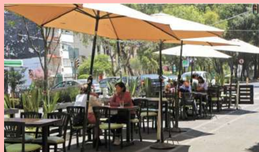
La Ciudad de México se mantiene y pasará a semáforo amarillo la próxima semana, extendiendo el horario y aforo para restaurantes. El Economista.