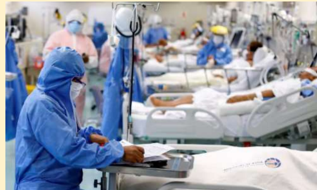
Un hospital exclusivo para pacientes Covid-19 en Perú.