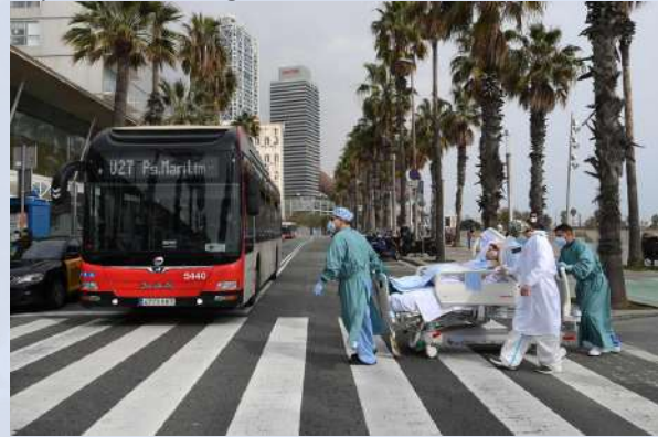
Paciente Covid-19 regresa al hospital en Barcelona después de salir a tomar aire.