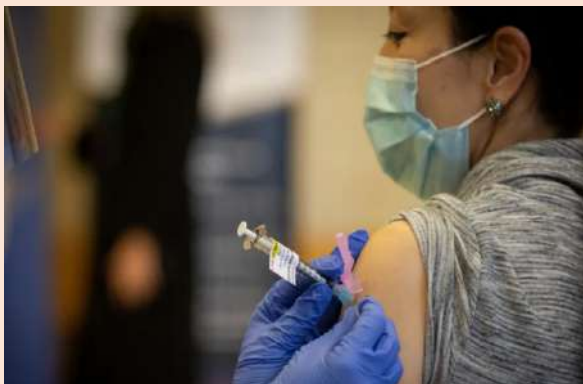
Aplicación de vacunas Covid-19 en Ontario, Canadá.