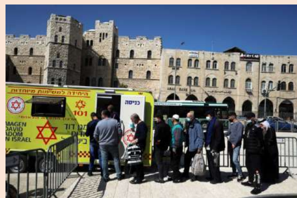
Personas hacen fila para vacunarse en un vehículo de vacunación móvil, Jerusalén.