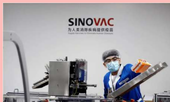
Planta de fabricación de la vacuna Covid-19 de Sinovac.

- FILIPINAS: Relajó las restricciones en Manila y las provincias circundantes ante una caída en los contagios.