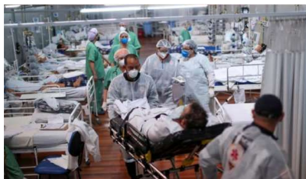
Centro hospitalario para pacientes Covid-19 en Brasil.