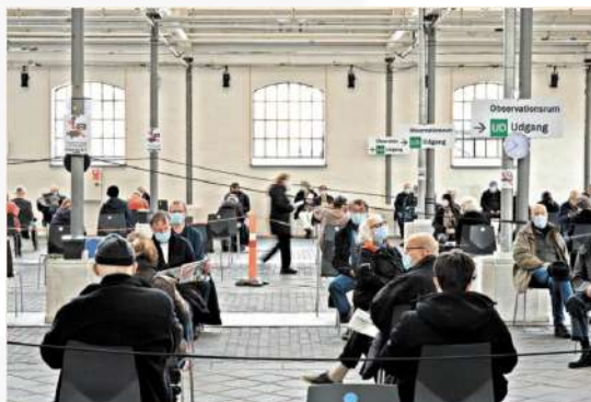
Centro de vacunación Covid-19 en Dinamarca.