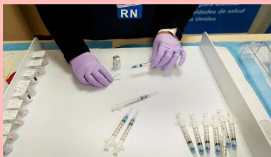
Una enfermera prepara vacunas Covid-19 en Los Angeles.