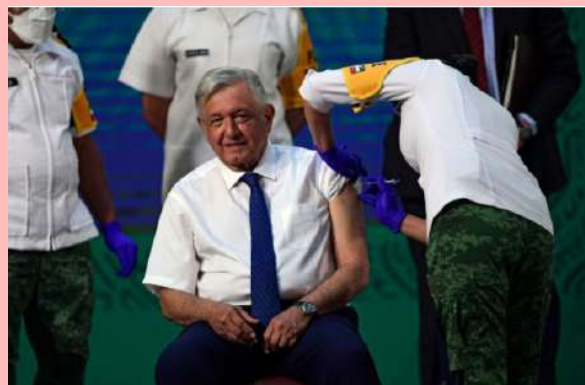
El presidente López Obrador recibió la primera dosis de la vacuna Covid-19 de AstraZeneca.