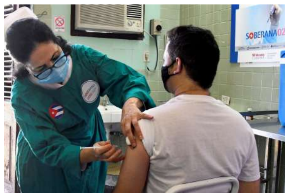
Un voluntario del ensayo clínico se aplica la vacuna Soberana 2 en Cuba Reuters.