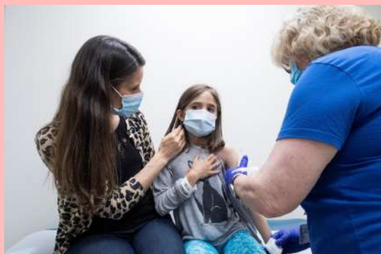
Campaña de vacunación contra Covid-19 para niños de 9 años en Carolina del Norte.