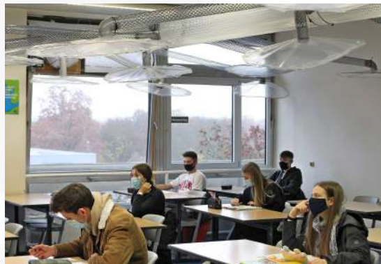
Las escuelas en Alemania instalaron un sistema de ventilación para prevenir los contagios de Covid-19. The New York Times.