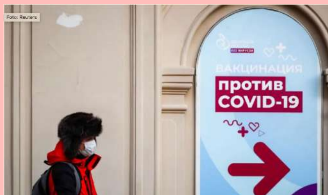
Centro de vacunación contra Covid-19 en Rusia.