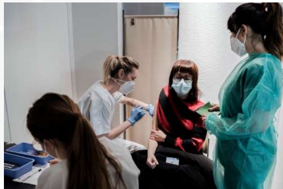
Una paciente recibe la vacuna Covid-19 de AstraZeneca-Oxford en Milan, Italia.

- AstraZeneca mostró que su vacuna Covid-19 tiene una eficacia del 79% y una ausencia del aumento en el riesgo de coágulos sanguíneos.