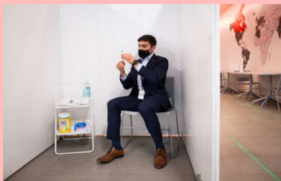
Un empleado de Air Canada se hace una prueba rápida de Covid-19 en el aeropuerto de Toronto.