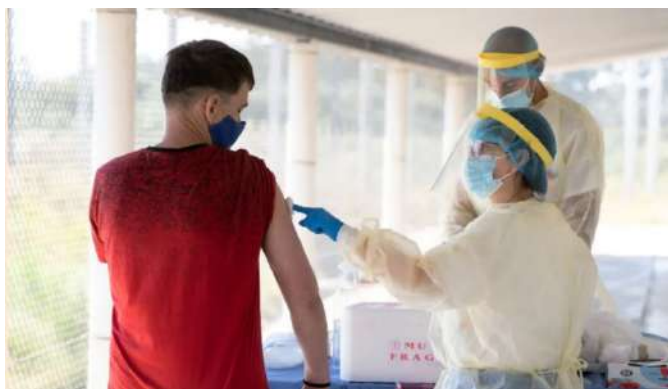
Campaña de vacunación contra Covid-19 en Uruguay.