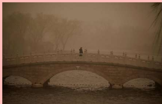
El uso de cubrebocas se extendió en China debido a la contaminación ambiental. The Guardian.

- AUSTRALIA: El gobierno afirmó que, fuera de las vacunas Covid-19 de AstraZeneca producidas localmente, el país no espera recibir vacunas del extranjero pronto.